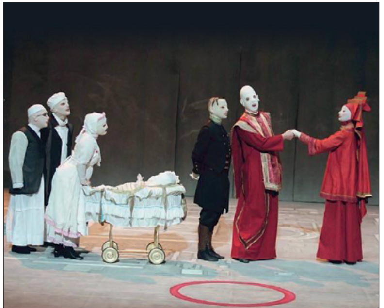
Le cercle de craie caucasien – mise en scène Benno Besson