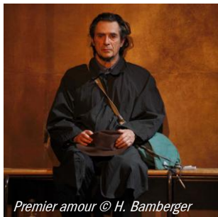
Premier amour