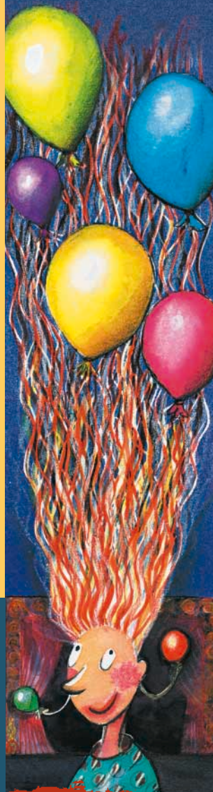
illustration: Catherine Louïs

4, Passage Maximilien-de-Meuron 2000 Neuchâtel Tél. (032) 717 79 07 Prix enfant: 15.- Plein tarif: 35.- tarif réduit: 25.-